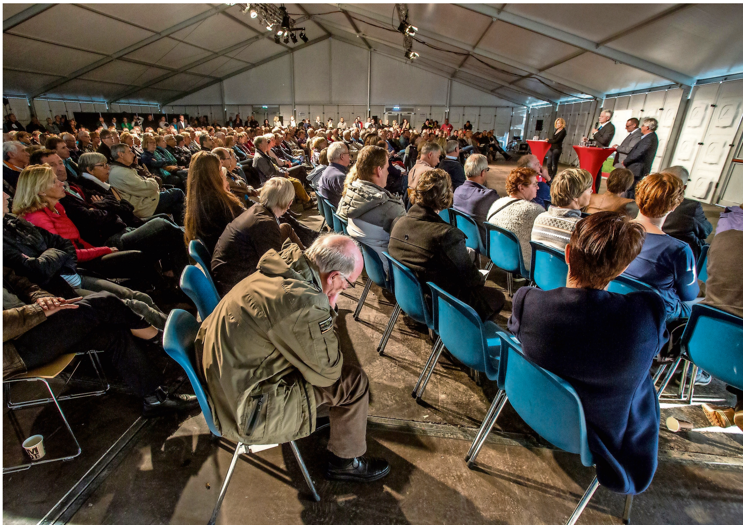
Een informatiebijeenkomst over vluchtelingen in Vijfhuizen. Raadsleden krijgen niet alleen schouderklompjes.